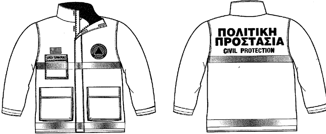
Εικόνα 1. Επιχειρησιακά μπουφάν Πολιτικής Προστασίας

Σύμφωνα με το 4678/22-11-2004 έγγραφο ΓΓΠΠ, τα επιχειρησιακά μπουφάν Πολιτικής Προστασίας θα πρέπει να έχουν την ακόλουθη μορφή: